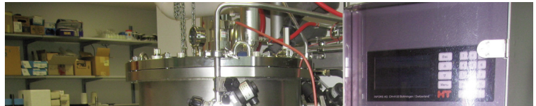
Production d'échantillon en grands volumes.

de technologies émergentes dans différentes disciplines en bio-médecine, tout en confortant les développements technologiques allant de la production d'échantillons à la détermination de structures 3D et l'intégration avec les données fonctionnelles.